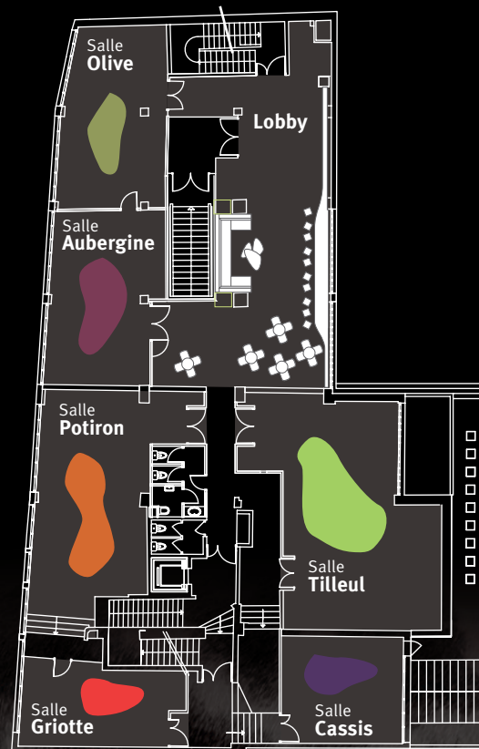
1 er étage